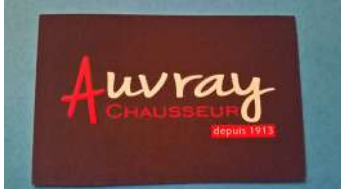
AUVRAY CHAUSSEUR LOUVIERS