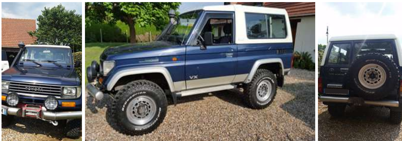
TOYOTA KZJ73 de 1996 - 160.000KMS - 125CV en cours de préparation

Tous les chemins mènent...à une aventure extraordinaire !