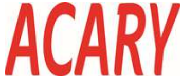
TRANSPORTS INTERURBAINS OISE