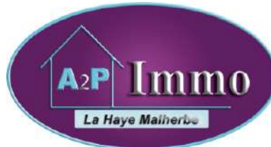
A2P IMMOBILIER LA HAYE MALHERBE