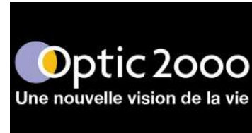
OPTIC 2000 LOUVIERS