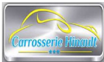
CARROSSERIE HINAULT ACQUIGNY