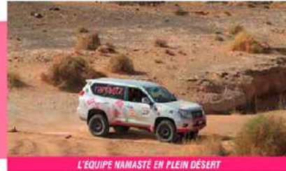
L'ÉQUIPE NAMASTÉ EN PLEIN DÉSERT

Le Trophée Roses des Sables s'inscrit dans la grande tradition des rallyes raids africains. Chaque jour, à bord d'un 4x4, d'un SSV, d'un quad ou d'une moto, les participantes s'élancent sur les pistes marocaines dotées de leur Road Book et de leur boussole. Un objectif : rejoindre la ligne d'arrivée en suivant au plus près le parcours tracé par l'organisation.