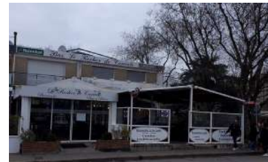
LE ROCHER DE CANCALE SOTTEVILLE-LÈS-ROUEN