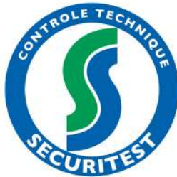
SÉCURITEST AMFREVILLE LA CAMPAGNE