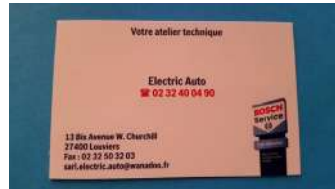
ELECTRIC AUTO LOUVIERS